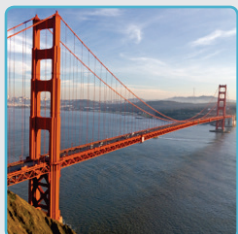
Golden Gate broen i San Francisco er en hengebro